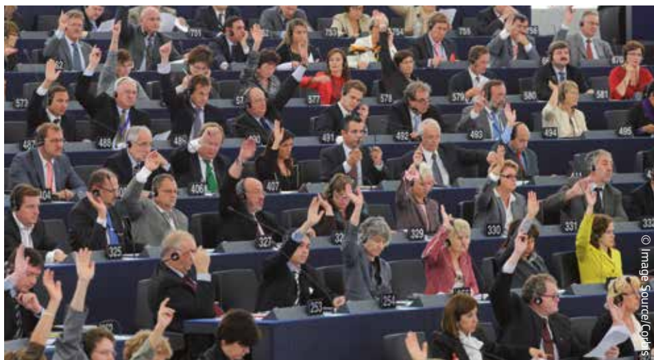
El Parlament Europeu és la institució de la UE on podeu fer sentir la vostra veu.

El 2011 l'alemany Martin Schultz, de l'Aliança Progressista de Socialistes i Demòcrates, va ser elegit President del Parlament Europeu.