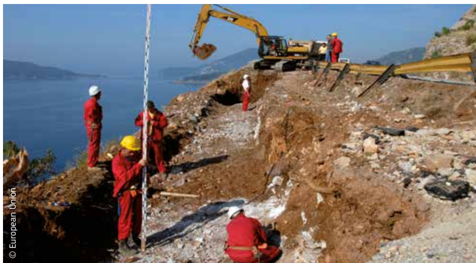
La UE concedeix ajuda financera als seus veïns per ajudar-los a fer tirar endavant la seva economia.

L'assistència financera de la UE a tots dos grups de països es gestiona a través de l'Instrument Europeu de Veïnatge i Associació.