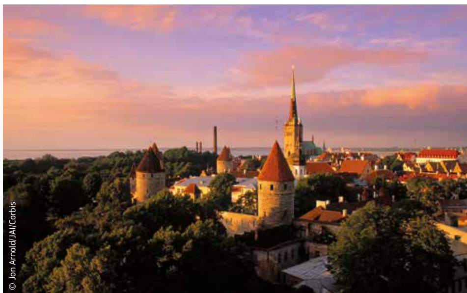
Tallinn, capital d'Estònia, on l'euro va substituir la corona estoniana el mes de gener del 2011.

La crisi financera del 2008 va fer augmentar moltíssim el deute públic a la majoria dels Estats membres. Ara bé, l'euro va protegir les economies més vulnerables del risc de devaluació i va fer possible aguantar la crisi i fer front als atacs dels especuladors.