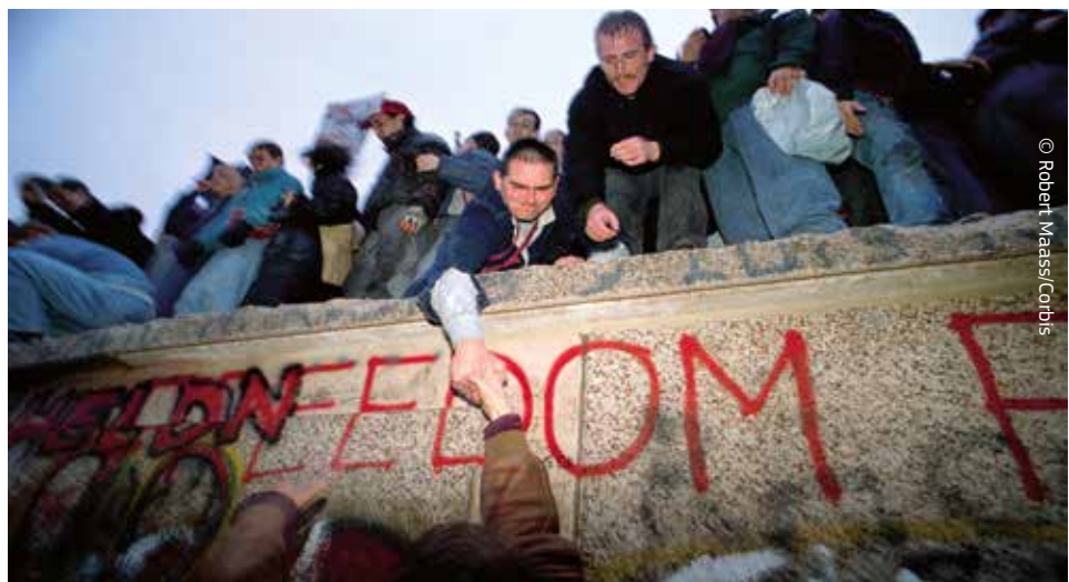
La caiguda del mur de Berlín el 1989 va fer que s'anessin esborrant les velles divisions del continent europeu.

La Unió Europea va fer possible la reunificació d'Alemanya després de la caiguda del mur de Berlín l'any 1989. Amb la descomposició de l'imperi soviètic, l'any 1991, els països de l'Europa Central i Oriental, que durant dècades havien viscut a l'altra banda del teló d'acer, van recuperar el dret a triar el seu destí i n'hi va haver molts que van decidir que havien de compartir el seu futur amb el concert de nacions europees democràtiques. Deu van ingressar a la UE el 2004, dos més el 2007 i finalment Croàcia ho va fer el 2013.