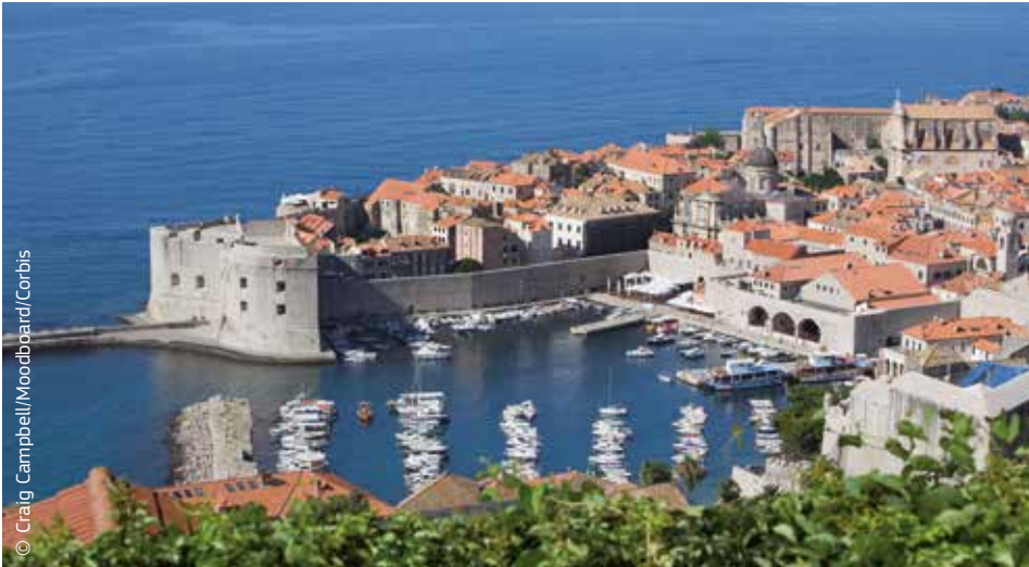
Dubrovnik, la perla de l'Adriàtic, a Croàcia, l'últim país que s'ha adherit a la UE.