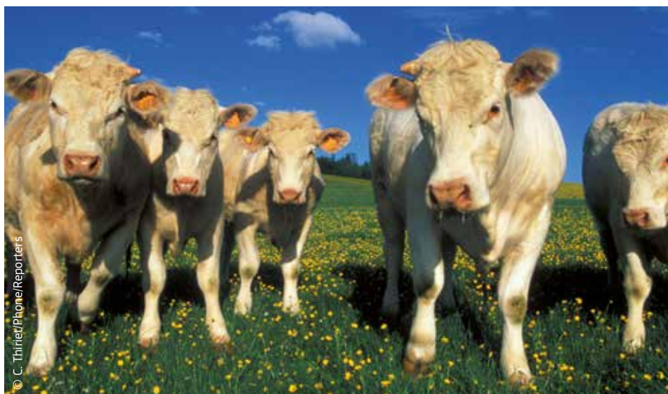
L'agricultura ha d'oferir productes alimentaris segurs i de qualitat.

El nou paper del món agrari és garantir una certa activitat econòmica a cada territori i protegir la diversitat del paisatge rural a Europa. Aquesta diversitat i el reconeixement del que representa la forma de vida rural i la relació harmoniosa entre l'home i la natura són elements molt importants de la identitat europea. A més, l'agricultura europea ha de tenir un paper important en la lluita contra el canvi climàtic, la preservació de la flora i la fauna i el subministrament d'aliments.