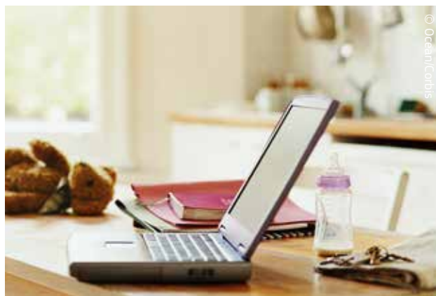
OUn dels drets establerts per la Carta dels Drets Fonamentals de la Unió Europea és el dret a conciliar la vida familiar amb la vida laboral.

El Tractat de Lisboa, que va entrar en vigor l'1 de desembre del 2009, atorga a la Carta el mateix caràcter jurídic que els Tractats de tal manera que la Carta pot constituir un fonament jurídic per interposar una demanda davant del Tribunal de Justícia de la UE. Tot i així, a Polònia i al Regne Unit, la Carta s'hi aplica amb certes restriccions jurisdiccionals; també s'aplica així a la República Txeca.